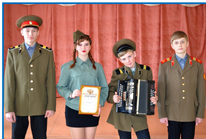
Победители конкурса — ученики 7 класса.

Учредитель: Администрация МКОУ «Вторая Сто- рожневская СОШ»